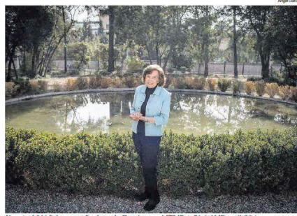
La bióloga Sylvia Earle, que aquest divendres va rebre l'honorific cançó per la IFLA... Teatre Principal de Vilanova la Geltrú.

Ha passat més de 7.000 hores tota focals i la revista 'Time' la va anomenar primera Heroína del Planeta. L'escocin primers ministres i estrelles de Hollywood. La bióloga marina nord-americana, la primera científica en cap de l'Administració Nacional Oceànica i Atmosfèrica, va rebre divendres l'honorific cançó per la Universitat Politècnica de Catalunya al Teatre Principal de Vilanova la Geltrú.